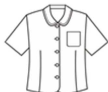
オーバーブラウス