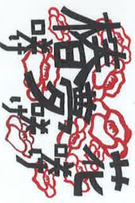
第34回体育大会テーマ